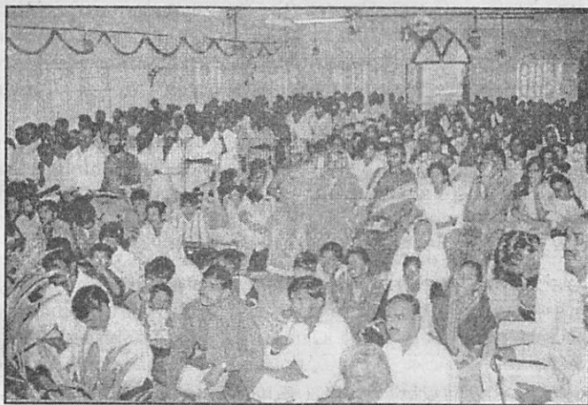
கருத்தரங்கில் பங்கு பெற்றோரின் மற்றொருபகுதி