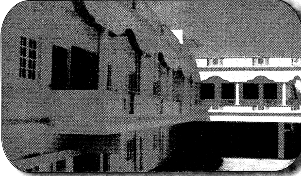
எக்லீசியா கல்லூரிக் கட்டிடத்தின் முகப்புத் தோற்றம்