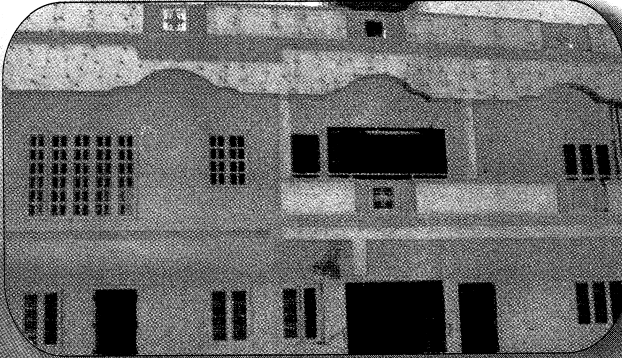
முகப்புத் தோற்றம் - வேறொரு கோணத்தில்