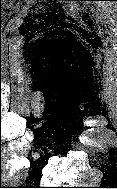
இதே போன்ற தகை கல்லறையில் இருந்து தான் முன்றாம் நாளில் இயேசு உயிர்த்தெழுந்தார்