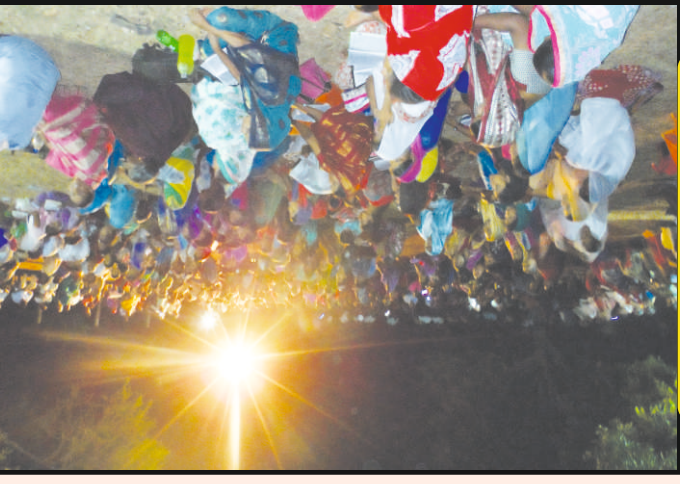
இயாதி மலர்நாள் கருநாடக ராஜ்யம்