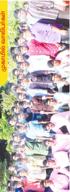
முகாமில் வாலிடர் பெண்கள்

Regd. News Paper RNI No. TNTAM/2006/20446 Postal regn. No. Erode/26/2015-2017 Posted at Erode HPO on 20/21 of Every Month. Licensed to Post without pre payment No: TN / WR / ERD / 03 / WPP / 2015-2017