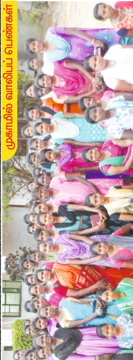
முகாமில் வாலிடர் பெண்கள்