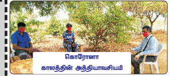
கொரோனா காலத்தின் அத்தியாவசியம்

India Post Payments Bank ARJUNAN 048410018536 IPOS0000001