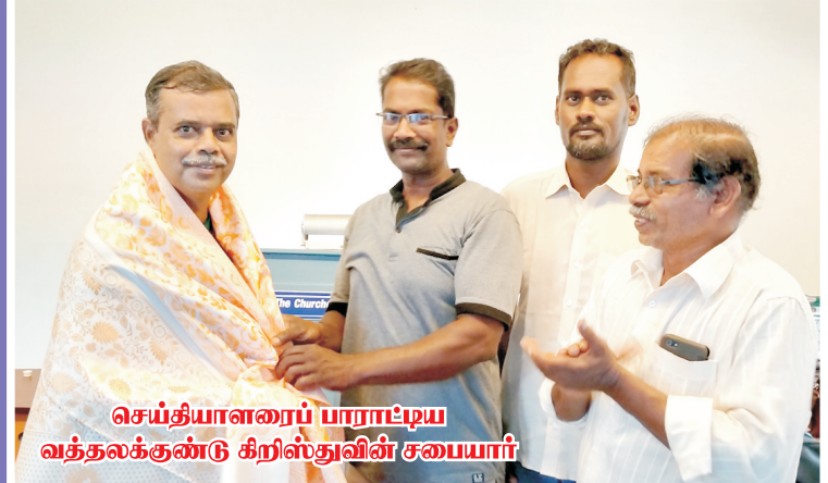
செய்தியாளரைப் பாராட்டிய வத்தலக்குண்டு கிறிஸ்துவின் சபையார்